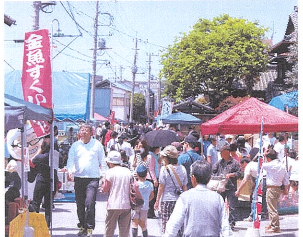
手づくり品のお店 出店します