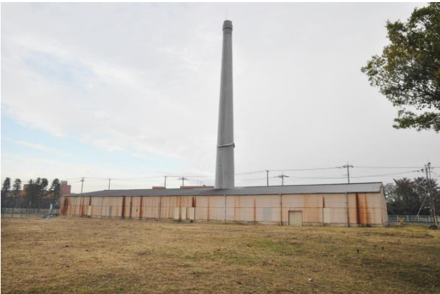
ホフマン輪窯6号窯外観

しかし、現在の屋根や外壁は景観上などで好ましくないことから、修理時に取り外した後、文化財の価値を高められるよう現状を変更したいと考えています。また、現在は煉瓦窯の外側を周ることができませんが、窯内部だけでなく外部を1周できるように回廊などを設置することも検討します。