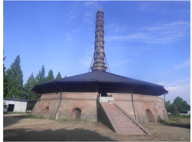
【参考】栃木県下都賀郡野木町のホフマン輪窯

鉄骨補強は、窯の内部に鉄骨を組んで崩落を防ぐ補強方法で、可逆性があり文化財に対するダメージが最も少ないものです。可逆性が求められる文化財の修理においては好ましい方法です。しかし、煉瓦窯のスケールを体感できる内部の景観を損ねるというデメリットもあります。